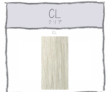
色味:CL 1:1 1Lv薄い色にする希釈剤。

バイオレットリーフが刺激臭を緩和。 アンモニア臭を抑え、快適な施術を実現 爽やかさの中に上質な柔らかさを感じさせる グリーンフローラルの香り。