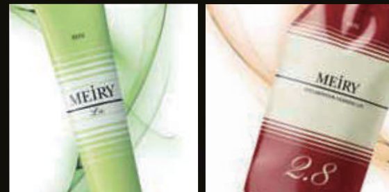
メイリーLu 酸化染毛剤 第1剤 / 全11色 内容量85g [医薬部外品] [実室専用]