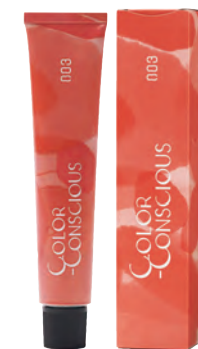
カラーコンシャス ファッションライン 49色 染毛剤 (医薬部外品) 80g