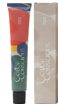
カラーコンシャス コンシャスライン 27色 染毛剤 (医薬部外品) 80g

ファッションラインとコンシャスラインでは、6・8・10レベルを同明度に設定しています。