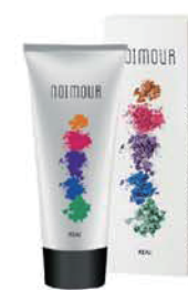
ノアムール 25色 (染毛料) 内容量: 150g 美容室専用