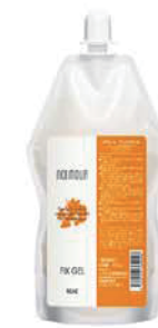
ノアムール フィックスジェル (ヘアトリートメント) 内容量: 400g 美容室専用