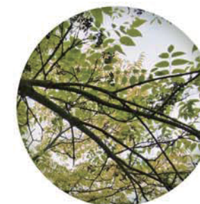
キハダ樹皮エキス

ハスの花は日本で「蓮華」(れんげ)とも呼ばれる水生植物。花から根まですべてが薬草として用いられる。多くの保湿成分を含んでいるほか、抗酸化効果もある。